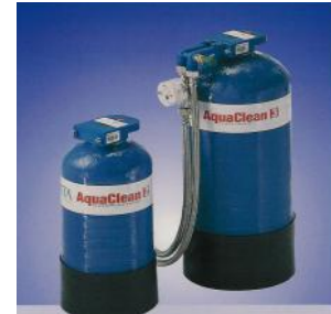
Wasseraufbereitungspatronen aus korrosionsbeständigem GFK (DIN / DVGW- geprüft), Verteilerkopf, Düsenstab, gefüllt mit dauerhaft regenerierbarem Ionenaustauscherharz

zur Entsalzung von eisen- und manganfreiem Trinkwasser